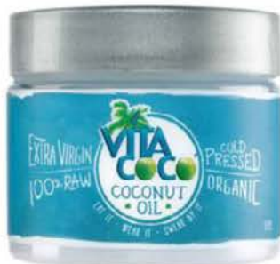
Huile de coco - Vita coco

L'huile de coco format voyage vous accompagnera partout cet été pour hydrater vos cheveux et votre peau.