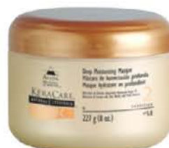
Deep moisturizing masque - Keracare

Le masque "Deep moisturizing" est parfait pour réparer et hydrater vos cheveux en profondeur.