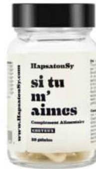
Complément alimentaire - 30 gélules Si tu m'aimes - Hapatou Sy

Les compléments alimentaires "Si tu m'aimes" à base d'extrait de roquette, de cuivre et de vitamines permettront de stimuler la pousse de vos cheveux cet été et tout au long de l'année.